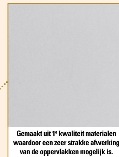
Gemaakt uit 1 e kwaliteit materialen waardoor een zeer strakke afwerking van de oppervlakken mogelijk is.