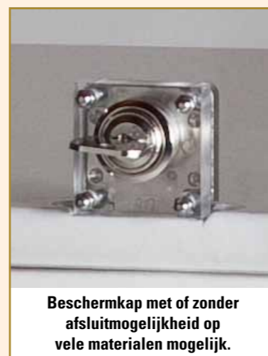
Beschermkap met of zonder afsluitmogelijkheid op vele materialen mogelijk.

Een sokkel, het klinkt als een eenvoudig product. Echter, als u goed kijkt komt er veel meer bij kijken. Jarenlang hebben wij gewerkt om per materiaal de kwaliteit te optimaliseren. Hieronder beschrijven wij deze kwaliteiten.