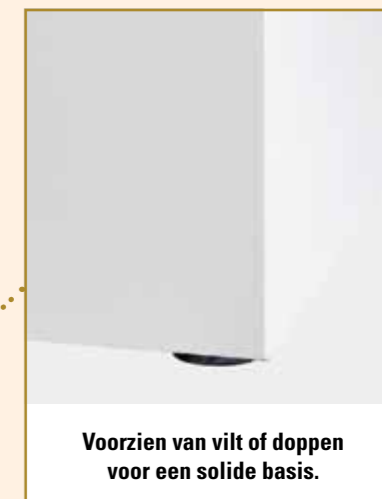
Voorzien van vilt of doppen voor een solide basis.